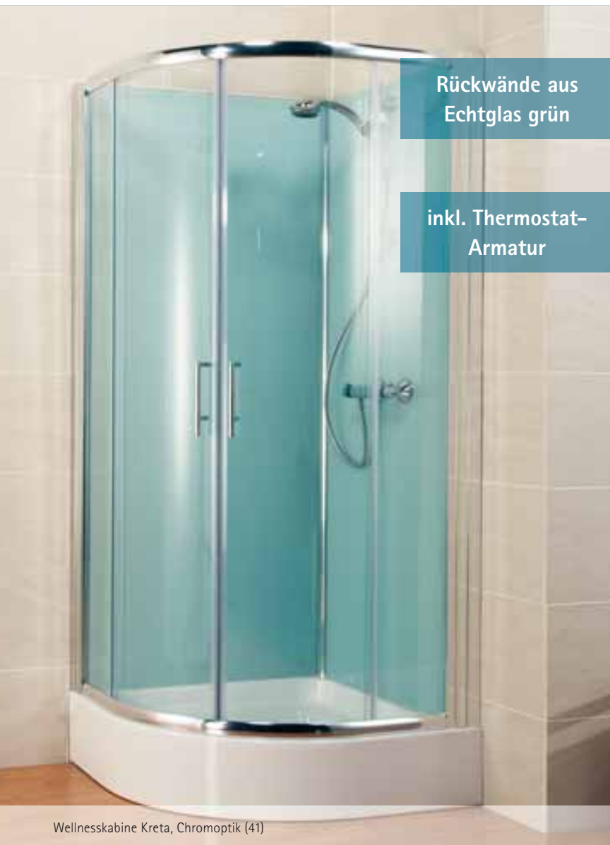
Wellnesskabine Kreta, Chromoptik (41)